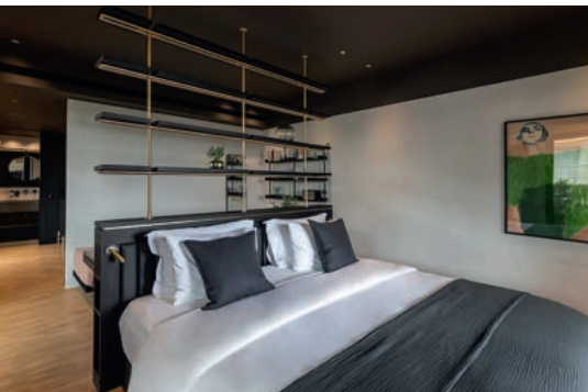
ΤΟ MID CENTURY DESIGN ΛΕΙΤΟΥΡΓΕΙ ΩΣ ΣΥΝΔΕΤΙΚΟΣ ΚΡΙΚΟΣ ΣΕ ΟΛΟ ΤΟ ΞΕΝΟΔΟΧΕΙΟ.